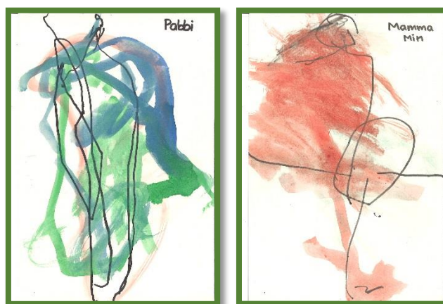
Myndir eftir tvö börn úr fjölskylduþema verkefninu-foreldrar fengu í jólagjöf frá börnum sínum lykklappu með mynd sem barnið þeira málaði.