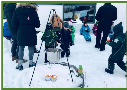
Útisúpuboð á degi leikskólans febrúar 2019.

Dagur leikskólans: Þann 6. febrúar ár hvert er dagur leikskólans og er markmiðið með deginum að kynna það starf sem fer fram í leikskólum landsins. Það var opið hús hjá okkur í hádeginu og buðum við upp á útisúpu. Við létum ekki kuldalegt veðrið stoppa okkur og áttum notalega stund saman í skjóli undir vestur vegg leikskólans okkar.