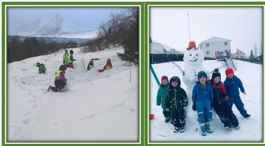
Útikennsla í skóginum og útivera- vetur 2018

Samkvæmt heilsustefnunni sem unnið er eftir á Laufási hefur barn mikla þörf fyrir að skapa og gerir það allar stundir í leik sínum. Það að vinna út frá eigin forsendum og með þann efnivið sem það kys hverju sinni gefur barni færi á að þroska alla hæfileika sína. Skapandi starf eflir gagnrýna hugsun barna, þjálfar rökhugsun og eflir skynjun barns og næmi fyrir umhverfinu. Á Laufási er lögð áhersla á að börnin kynnist fjölbreyttum efnivið og í tengslum við þema skólaársins var lögð áhersla á listsköpun í tengslum við vettvangsferðir og útinám.