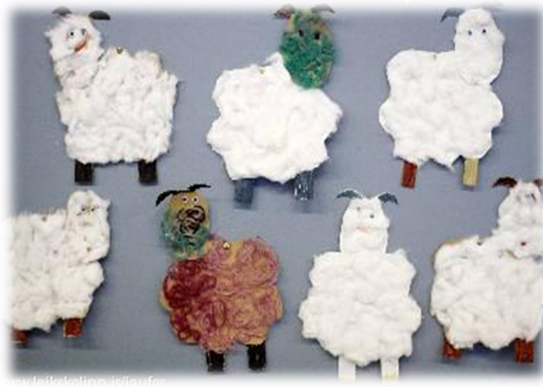
Kindur unnið í Laufási 2014